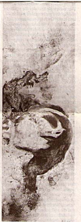
„Träumende Frau“ hat die Künstlerin Petra Heck dieses Werk genannt.

Zeitgleich mit den Werken Hecks macht die Wanderausstellung „FrauenAnsichten“ in Dormagen Station: In der ersten Etage des Kulturhauses hängen die Porträts von zehn Dormagenerinnen, die sich für das gleichnamige Buchprojekt von der Gruppe Octopuss hatten malen lassen. Als Leihgabe aus Neuss sind